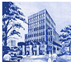
Comergon Cyprus Λευκωσία, Κύπρος