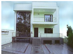
Comergon Greece Μαρούσι, Αθήνα