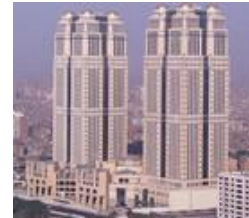
Comergon Egypt Κάιρο, Αίγυπτος